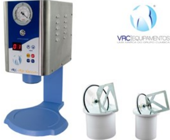
Espatulador al Vacio