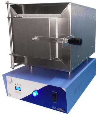
Horno Automatico Lexus