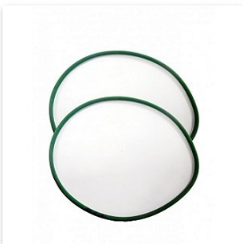
Banda Verde para motor