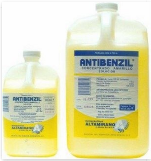
Antibenzil amarillo Galon