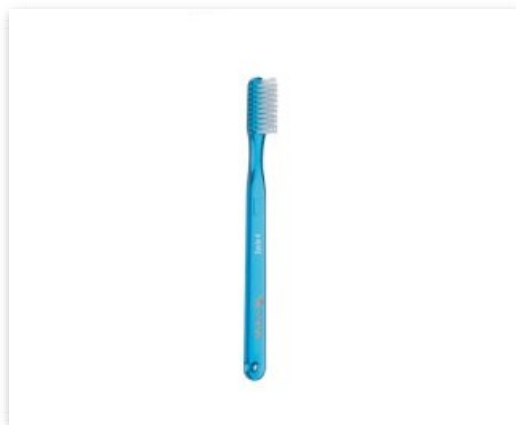
Cepillo de 4 Hileras