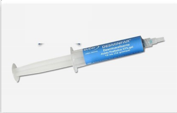
Acido Grabador 10 ml