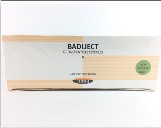
Badiject agujas extracortas x 100