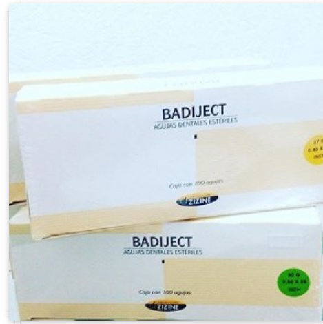
Badiject agujas cortas x 100