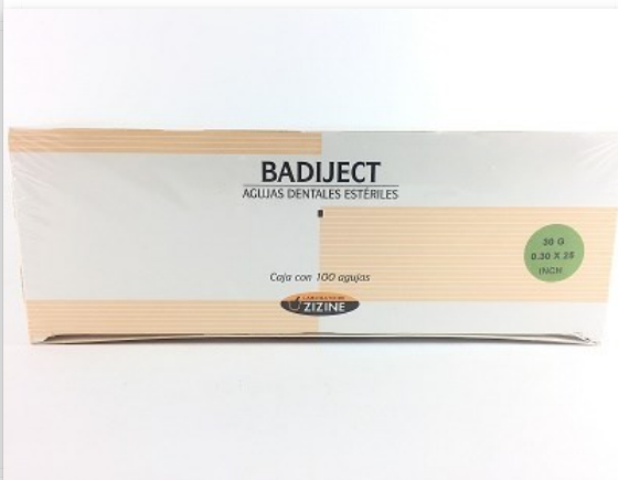
Badiject Agujas Largas x 100