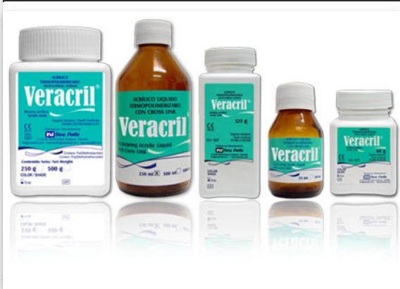
Acrilico Thermocurado 1 litro