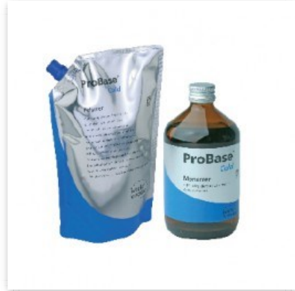
Acrilico Rapido 1 Litro