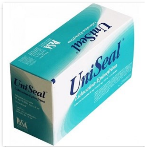
Aguja Larga Uniseal