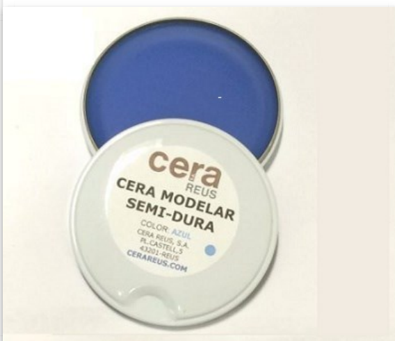
Cera modelar azul claro