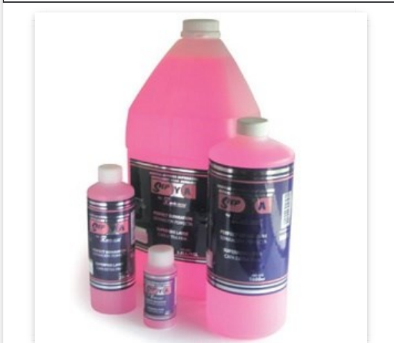
Acrilico Normal 125 ml mdc