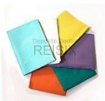
Campos medicom lavanda