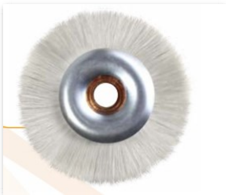
Cepillo Mediano Blanco Valplast