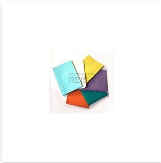
Campos medicom aqua