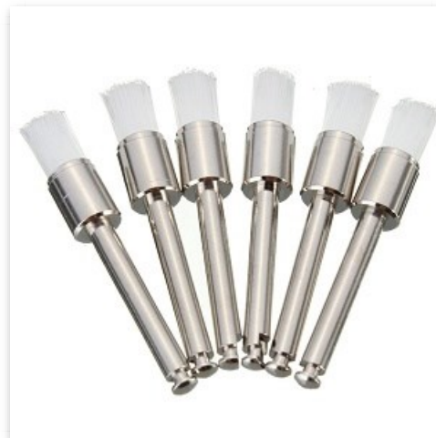
Cepillo profilaxis blanco