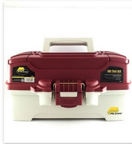
Caja Plano 1 charola 6201