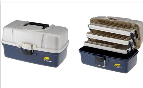
Caja Plano 6133