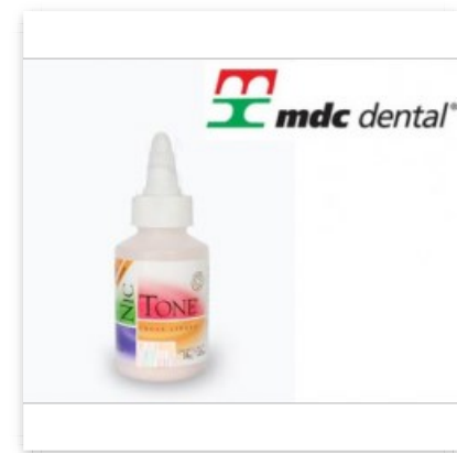
Acrilico Rapido Liquido 125 ml mdc