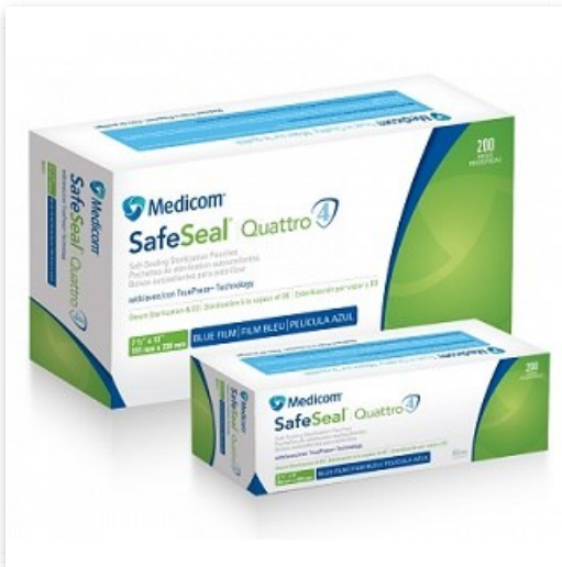
Bolsa para esterelizar 5 1/4 x10