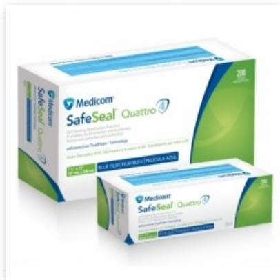
Bolsa para esterelizar 3 1/2 x 9